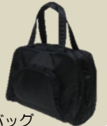
ブラックサテンバッグ

II. 1回のお申し込みで、2セット（組み合わせ自由）ご購入の場合のみ、マミエール・オリジナル豪華サテンバッグをプレゼント致します。